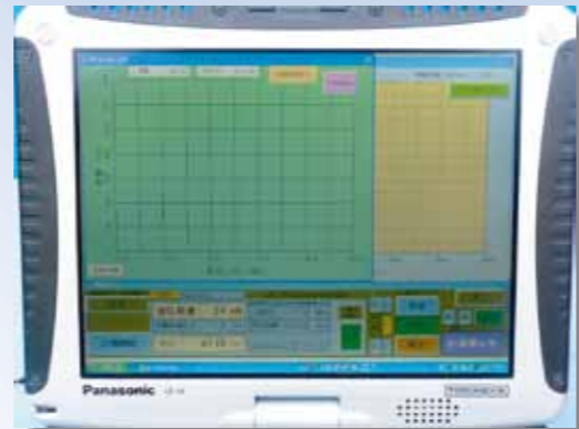
タッチパネル画面