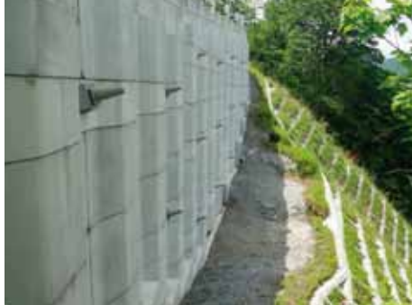
写真-4 壁面状況（オーレン, H=1.5-8.0m）