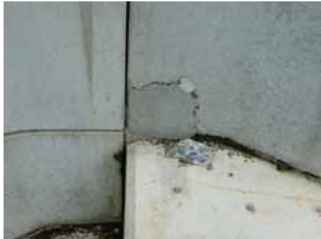
写真-6 基礎との境界部に欠け（茂庭沢）