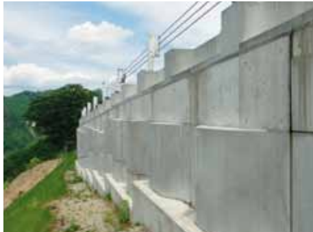
写真-5 壁面状況（烏帽子の2, H=2.0-4.0m）