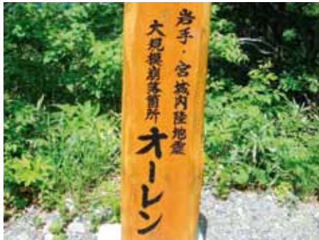
写真-2 施工地には崩落履歴を示す碑が立つ