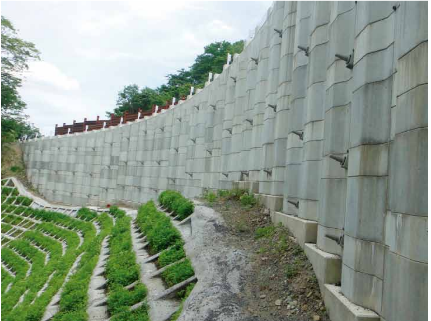
写真 -1 震度 6 弱の揺れに耐え、国道 342 号線を守った親杭パネル壁工法（岩手県一関市・茂庭沢，壁体高 H=1.5-11.0m）