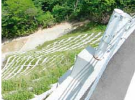
写真-3 天端状況（オーレン）