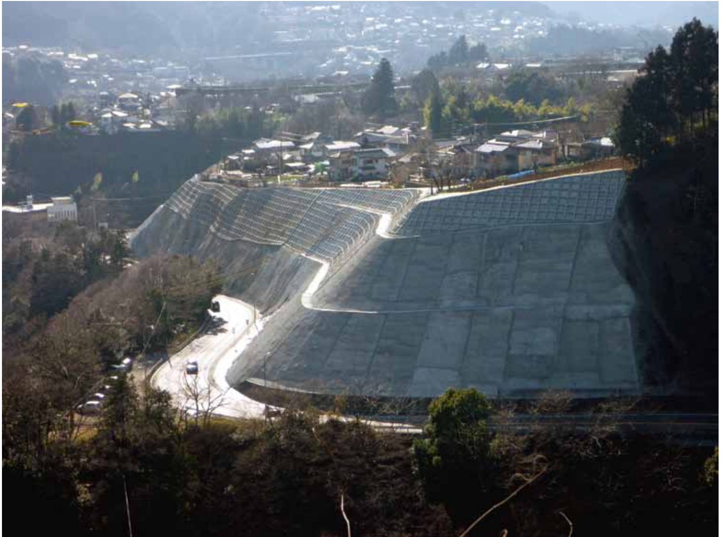
写真-1 実証試験を実施した法面（国道20号・神奈川県相模原市）

当社は、法面専用の有機繊維を開発し、従来から用いられている湿式吹付方式の設備による繊維補強モルタルの吹付への適用について現場において実証試験を行い、適用性を確認しました。