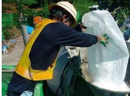
写真-4 現地でBCファイバーを投入