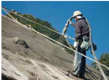
写真-7 脈動のないスムーズな吹付