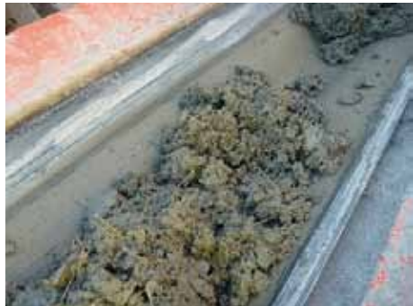
写真-5 モルタル中にBCファイバーが分散