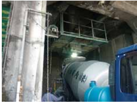
写真-3 材料は生モルタル（現場練りも可）