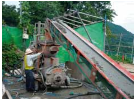
写真-6 材料を汎用の湿式吹付機に投入