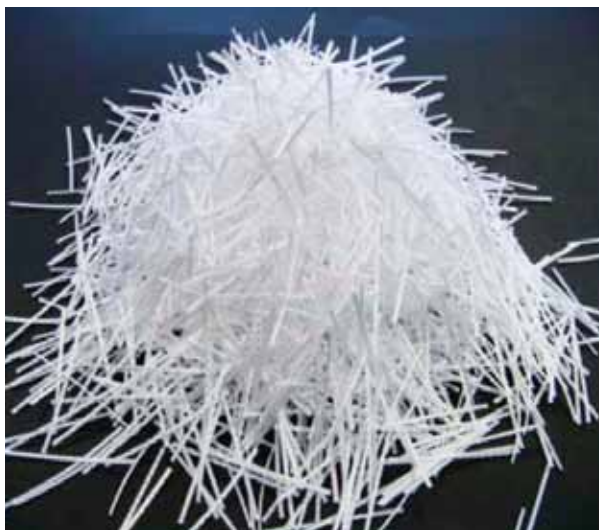
写真-2 汎用湿式吹付方式で施工可能な有機繊維「BC ファイバー」