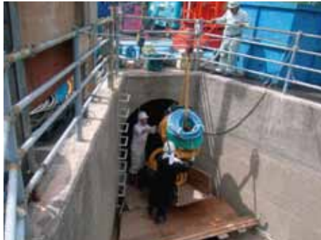
写真-4 ホースをリヤカーに載せて搬入