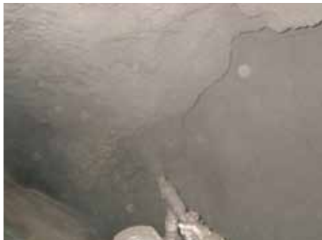
写真-7 高い急結性で上向き吹付も良好