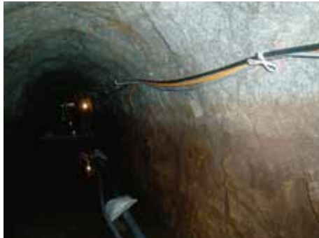
写真-5 施工対象である素掘り部