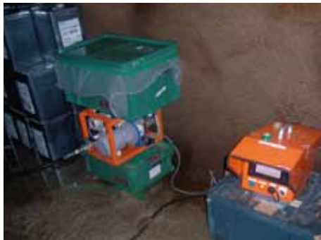
写真-6 急結材ポンプと COGMA は坑内に設置