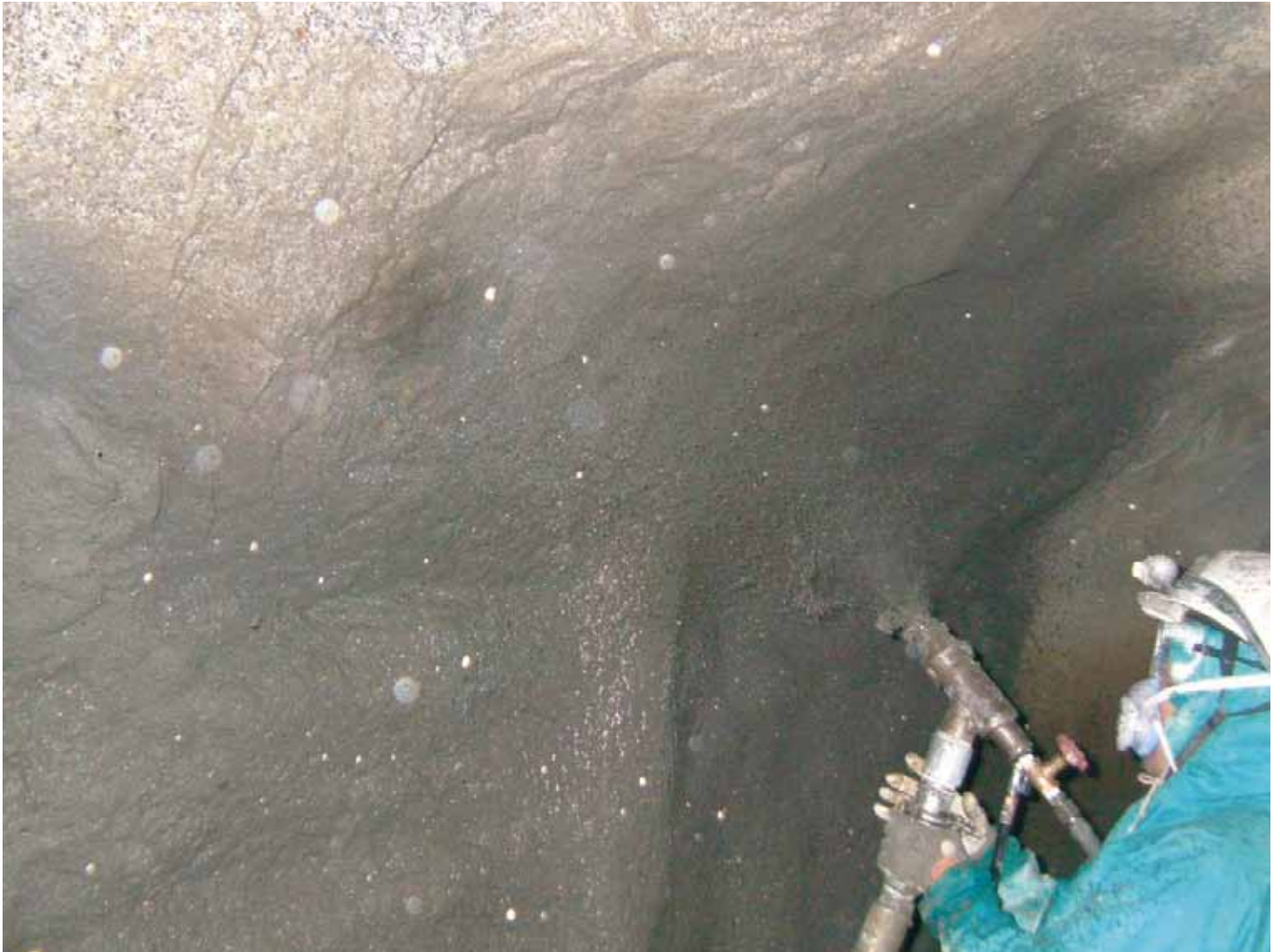
写真-1 坑外から 1.5 インチホースで材料を 900m 圧送し、導水路トンネル坑内の素掘り部へ吹付（鹿児島県）