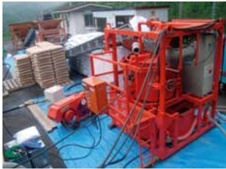
写真-3 材料製造・圧送プラント