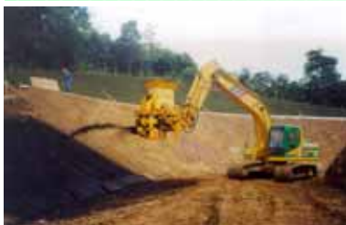
ネッコチップ工法

当社は、社会的課題となっている産業廃棄物のリサイクル向上技術を基に、循環型社会の形成に向けた取り組みを行っています。特に建設現場で発生する現地発生土、伐採樹木の有効活用を目指した緑化工法を開発しています。