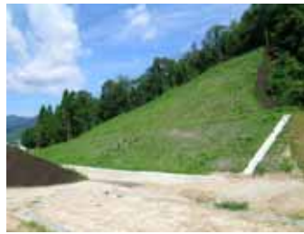
周辺の景観・生態系に調和した緑化

エコロードとして計画され、地域に自生した植物の再生が求められました。 カエルドグリーン工法による森林表土に含まれる埋土種子を利用した緑化を行いました。 埋土種子の利用は、地域個体群の遺伝的攪乱の防止の観点からも有効です。