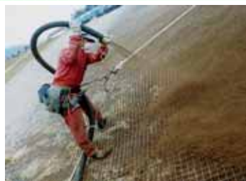
カエルドグリーン工法

現地発生表土、伐採木を利用して植生基盤を生成し法面緑化を図る「リサイクル」型緑化工法。