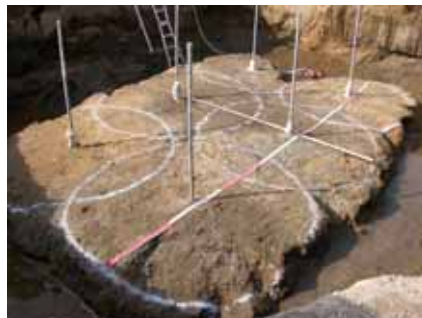
大容量・急速施工の液状化対策注入工法

エキスパッカ-N工法は、高速・広範囲に注入材を吐出できる特殊な注入管によって、既設構造物に影響を与えず、スピーディに地盤を改良する液状化対策注入工法です。改良径 3m の造成が可能のため削孔本数が大幅に低減でき、省資源・低コストの地盤改良工法です。