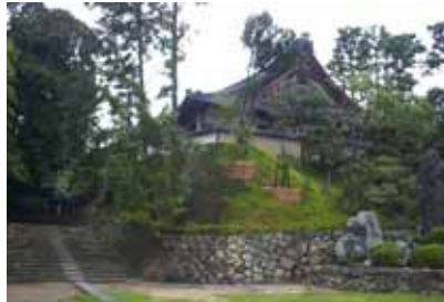
文化財の景観を考慮した植生工