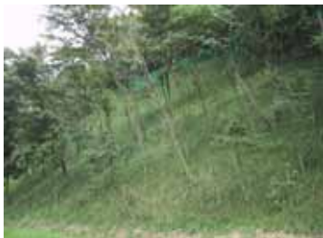
既存木を生かした斜面对策工 ジオファイバー工法により、既存木を出来る限り残して、斜面の安定化を図りました。

従来型の防災技術はともすれば環境破壊につながりかねないものが主流でした。当社は、環境・防災・維持管理関連の専門技術を得意とする建設会社として、環境に配慮した防災技術の開発を進めて参りました。これらの技術のさらなる環境影響低減を目指して研究・開発を進めるとともに、設計・検討を通じて技術の普及を図っております。