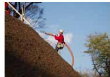
エコポングリーン工法

土工事によって発生した建設発生土を、植生基盤として「緑の斜面」に再利用する工法。