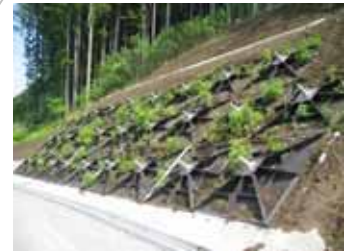
緑化受圧板の使用 緑化可能な受圧板を使用し、景観に配慮しながら、斜面の安定化を図っています。