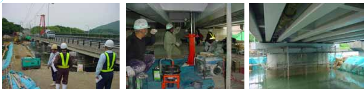
橋脚補強工、支承改良工、落橋防止工、表面被覆工

過去のマニュアルの見直しをはじめ新技術・工法の開発も活発であり、更に補修・補強工事においては現状を把握した対応（技術提案等）能力が施工者へ求められている現状にあります。日特建設では保有技術はもとより、施工実績による技術蓄積や新技術を広く吸収・活用することにより、環境負荷に配慮した補修・補強工法を展開します。