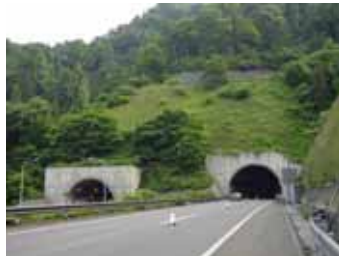
トンネル坑口斜面の景観創出 ジオファイバー工法により、トンネル坑口斜面の安定を図りながら緑の景観を創出しています。