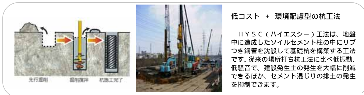
低コスト + 環境配慮型の杭工法

社会環境の大きな変化や、都市問題の顕在化により、「都市の再生」への取り組みが強く求められております。当社は得意とする掘削、地盤改良の分野で、都市環境の改善に寄与できる技術の開発・普及に努めて参りました。都市土木においては、建設発生土などの産業廃棄物発生抑制、騒音・振動などの低減が求められます。当社は排泥や騒音・振動の少ない工法の開発に参り、その成果を設計・検討に取り入れることにより普及を図っております。